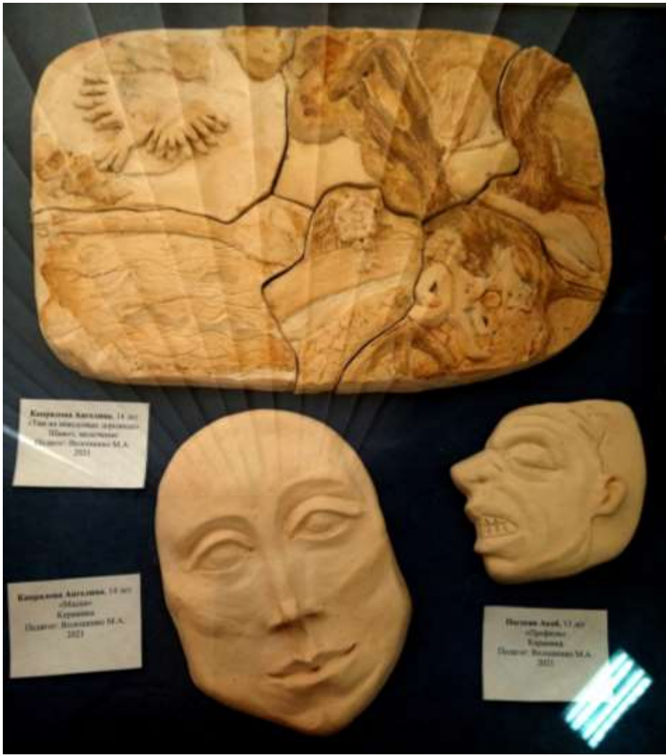
Керамическая табличка, 14 вв. «Паня» из коллекции археологов Шанга, провинция Шаньси (Восточный М.А. 2021)